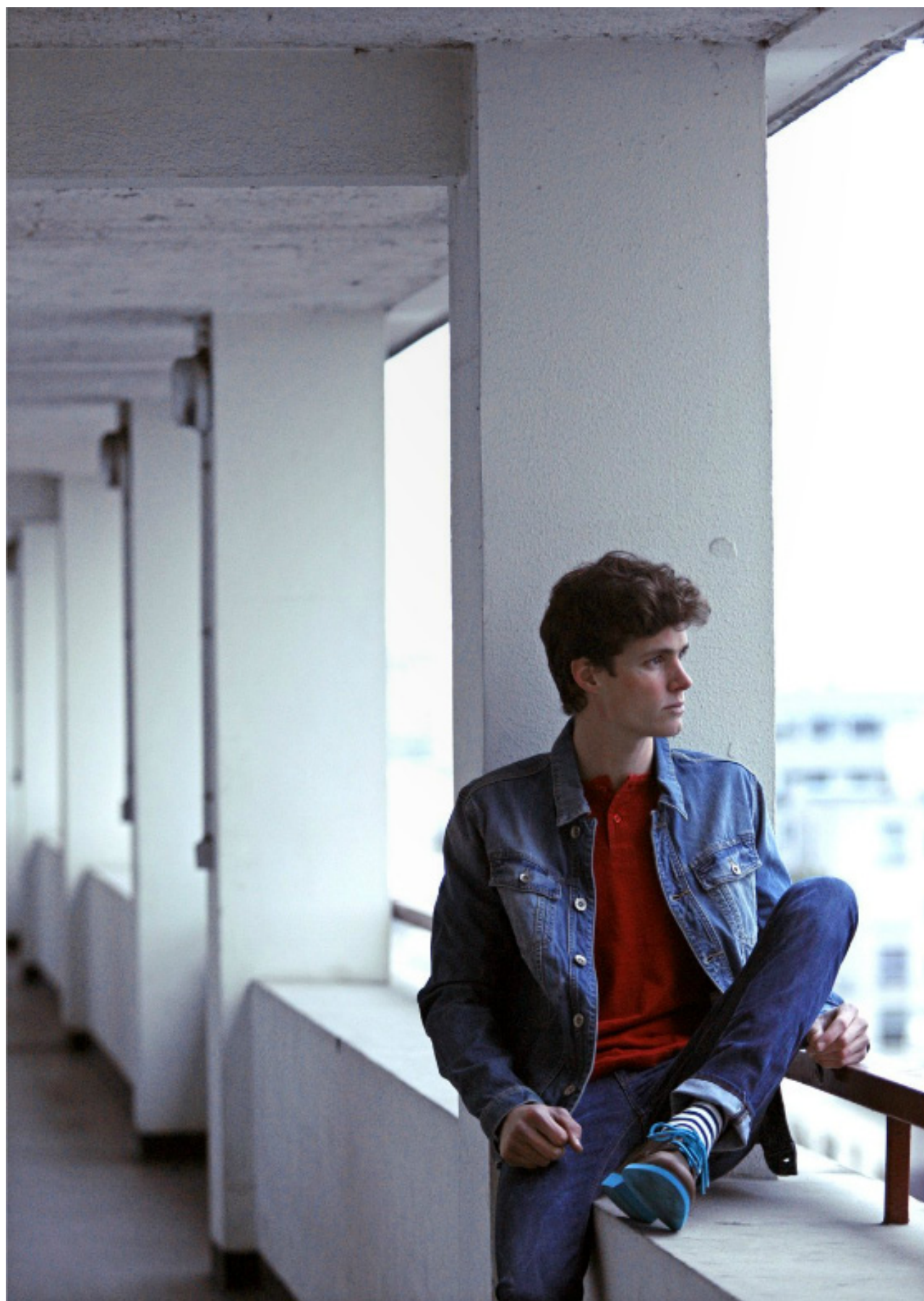
Veste en denim GARCIA , T-shirt rouge MEDWINDS , jeans slim APRIL 77 , chaussettes rayé HOM , chaussures SPERRY